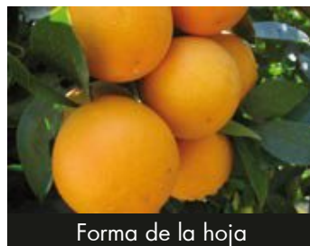
Forma de la hoja