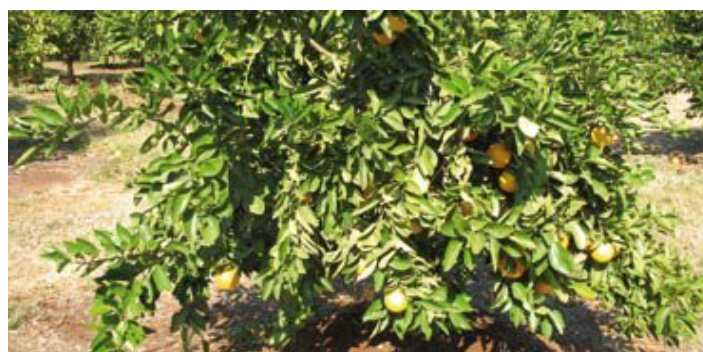
Árbol con fruta