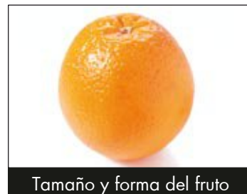
Tamaño y forma del fruto