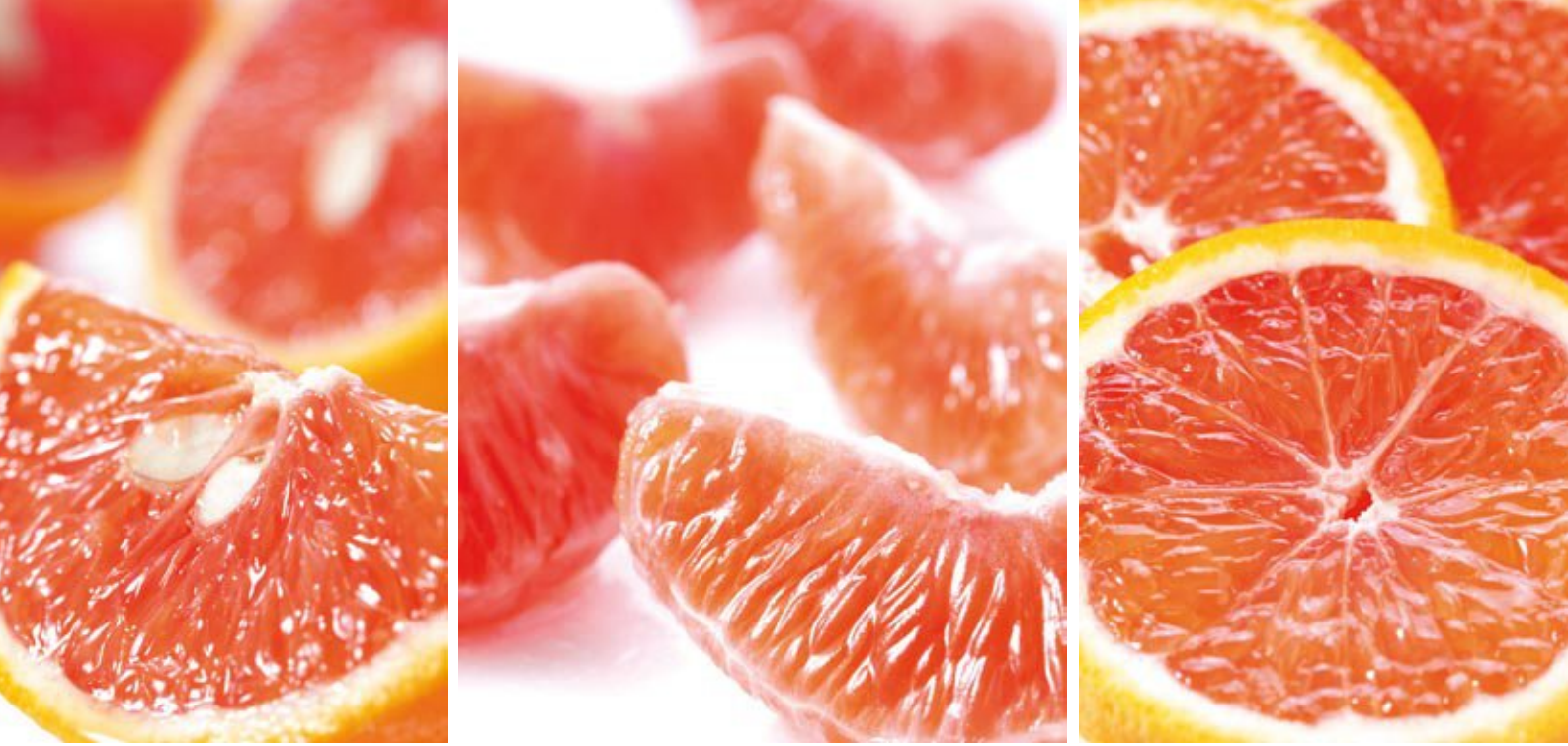
Ruby Late Maturing Valencia