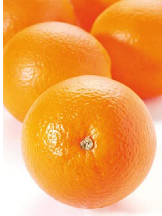
Witkrans Late Maturing Navel