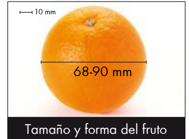
Tamaño y forma del fruto