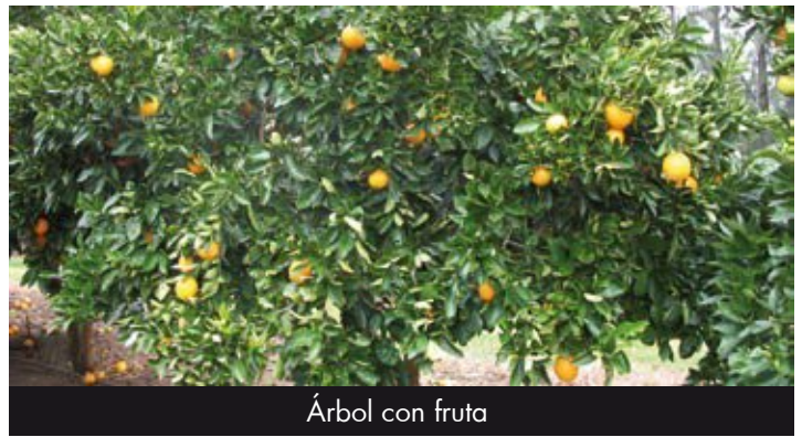
Árbol con fruta