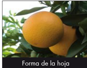
Forma de la hoja