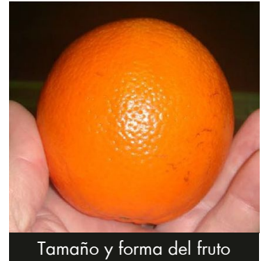
Tamaño y forma del fruto