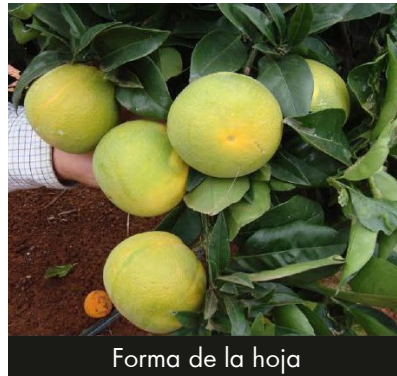
Forma de la hoja