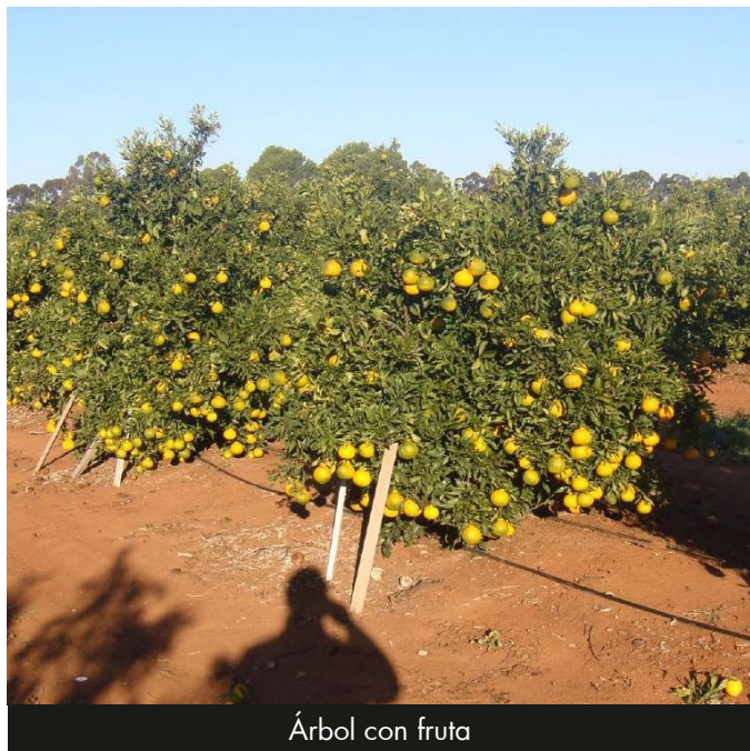
Árbol con fruta